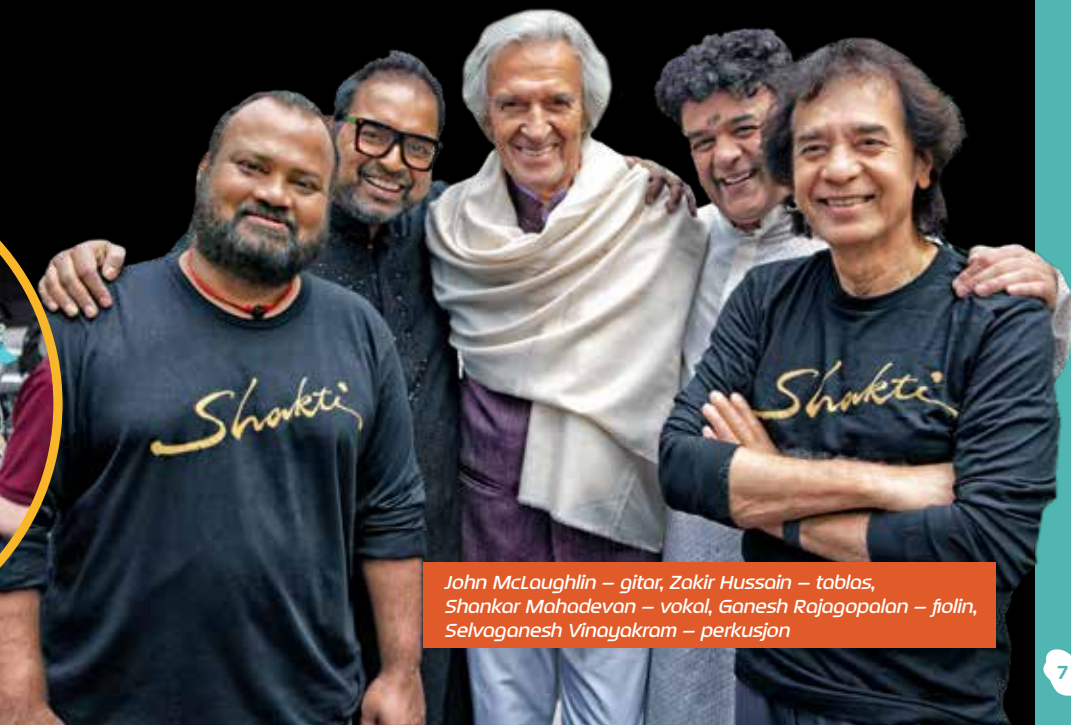
John McLaughlin – gitar, Zakir Hussain – tablas, Shankar Mahadevan – vokal, Ganesh Rajagopalan – fiolin, Selvaganesh Vinayakram – perkusjon

Shakti med John McLaughlin og Zakir Hussain gjenoppstår i 2023, og spiller årets åpningskonsert på Kongsberg Jazzfestival! En av jazzens supergrupper og pionerer innen world music-sjangeren, er klare for å feire sitt 50-årsjubileum med ny plate og omfattende turnering der de fortsetter å pløye ny musikalsk mark og grensene mellom øst og vest brytes ned. Møtet mellom en engelsk gitarist med jazz, rock og fusjon i bagasjen og indiske musikere med djupe røtter både i klassisk og tradisjonell indisk musikk, skulle resultere i en helt enestående og fascinerende musikalsk sammensmeltning med appell til store lytterskarer.